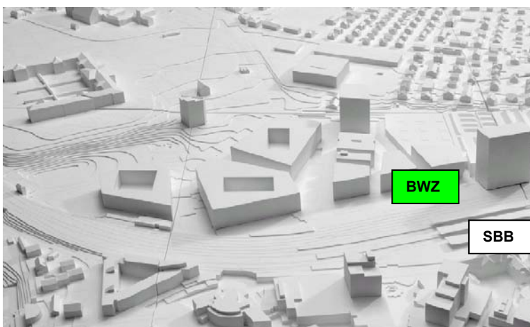
Modellansicht mit Campusbauten